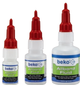
10 g Art.-Nr. 261 10 20 g Art.-Nr. 261 20 50 g Art.-Nr. 261 50