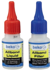
Liquid 20 g + Filler 20 g Art.-Nr. 261 7 20